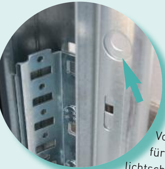
Optional: Vorgerichtet für Zargenlichtschranke, die mit der Zarge fest verbaut ist